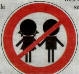
Divieto d'accesso ai bimbi